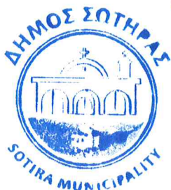
..... Μιχάλης Κκάλλης